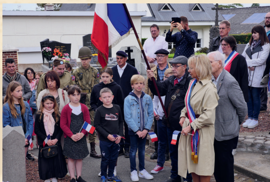
Les jeunes Fouquiérois sont associés aux cérémonies au monument aux morts.