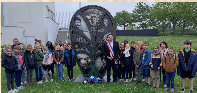
Un dépôt de gerbe le 22 mai 2023 au pied de la stèle située au Musée 14-18 de Souchez avec les jeunes de l'école Yves Duteil dans le cadre du projet les petits passeurs de la mémoire Fouquiéroise