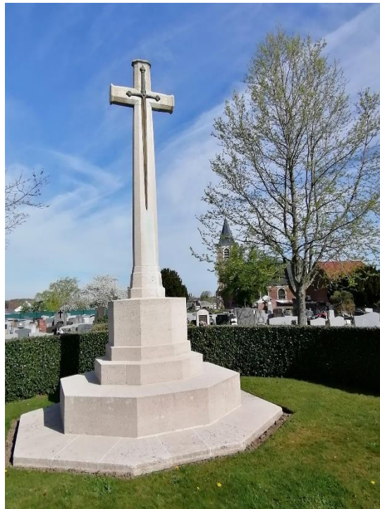
Croix du cimetière militaire de Fouquières

A priori, rien n'est destiné à relier notre commune à celle de Bayeux en Normandie. Et pourtant. Si vous observez la Croix présente à Bayeux au cimetière militaire anglais et celle présente dans la commune, vous remarquerez de grandes similitudes.