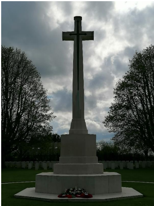
Croix du cimetière militaire de Bayeux